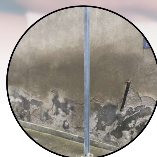
Linha de umidade